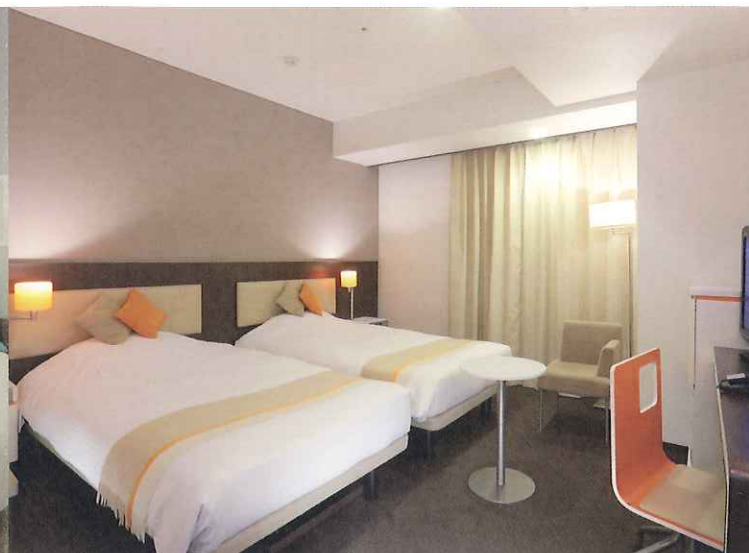
スタンダードツイン (22㎡)