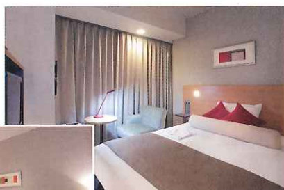
コンフォートシングル (15㎡)