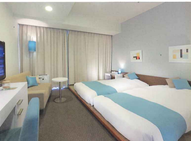
レディースツイン (22㎡)