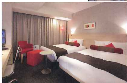
エグゼクティブワイドツイン (22㎡)