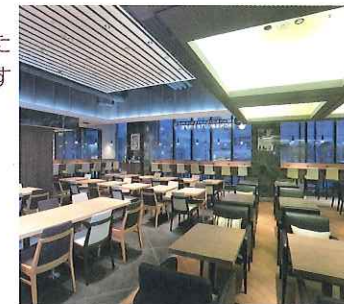
1F/ BONSLUTE CAFÉ ボンサルルーテ・カフェ

「しっかりとした朝食をとり たい」というニーズにお応え して、厳選した食材をいつも おいしい状態でご提供します 「しっかりした朝食で充実し た一日の活力を」