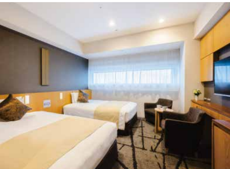
ツインルーム一例