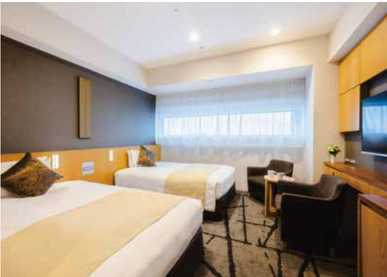
ツインルーム一例