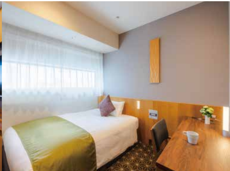
シングルルーム一例