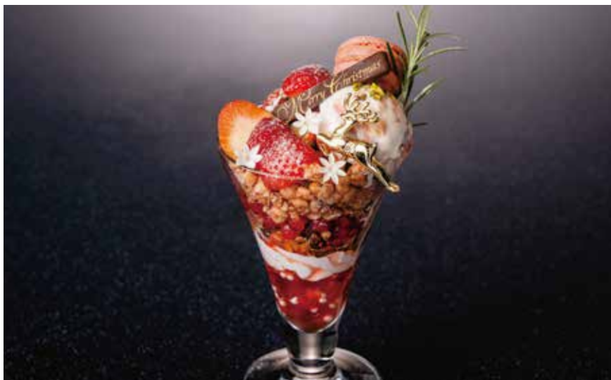
Strawberry parfait ストロベリーパフェ Christmas Ver. (Strawberry, Strawberry macaron, Strawberry Ice Cream, Chocolate brownie etc.)

Limited time offer: From December 1st to 25th ,2025