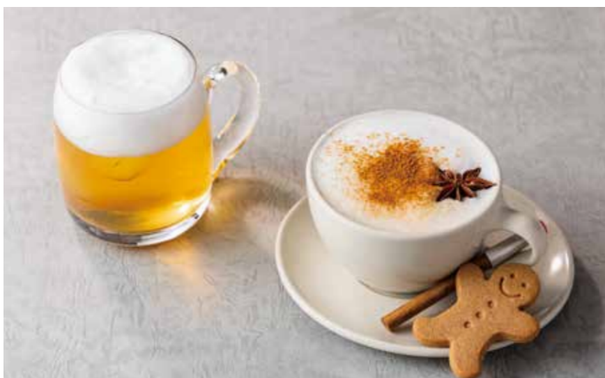
Masala chai Christmas Ver. ..... ¥1,980 マサラチャイ