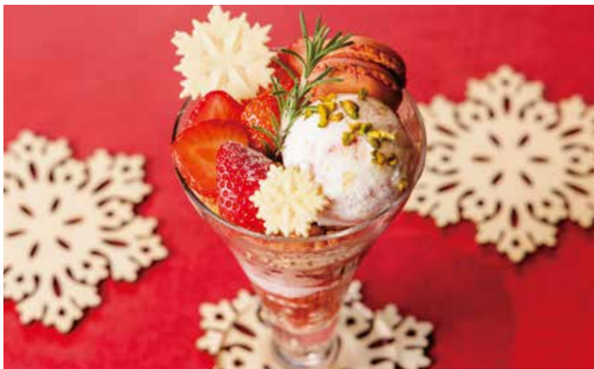
Strawberry parfait (Strawberry, Strawberry macaron, Strawberry Ice Cream, Chocolate brownie etc.)

Limited time offer: From November 1st, 2025 to February 28th, 2026