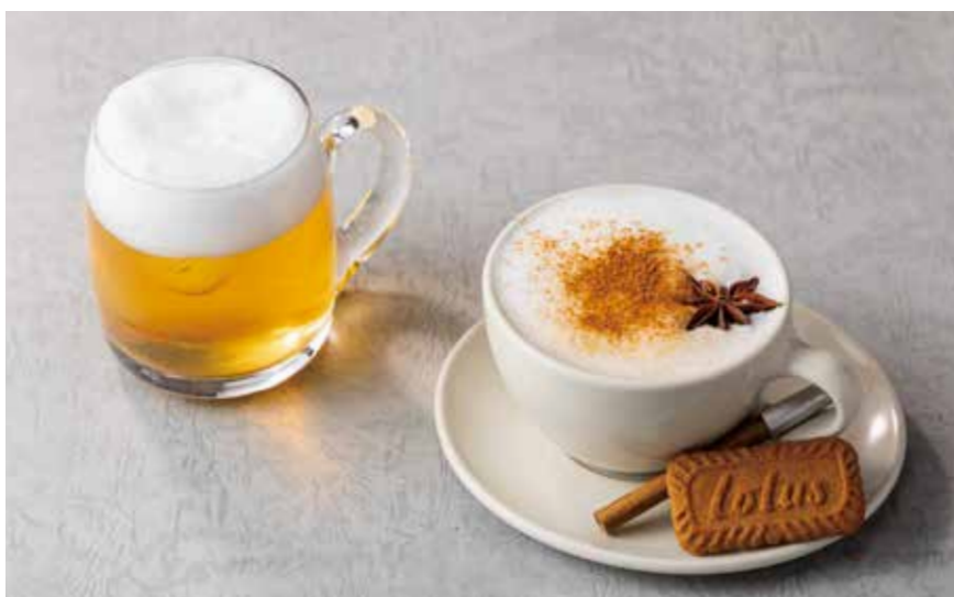
Masala chai ..... ¥1,980