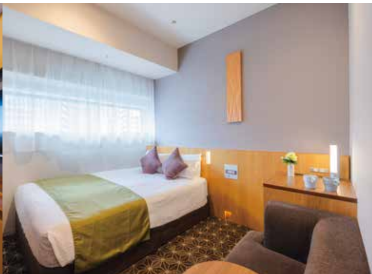
ダブルルーム一例