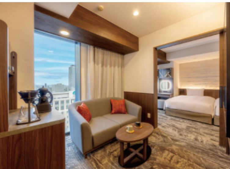
エグゼクティブフロアデラックスツインルーム (30㎡) ※一例