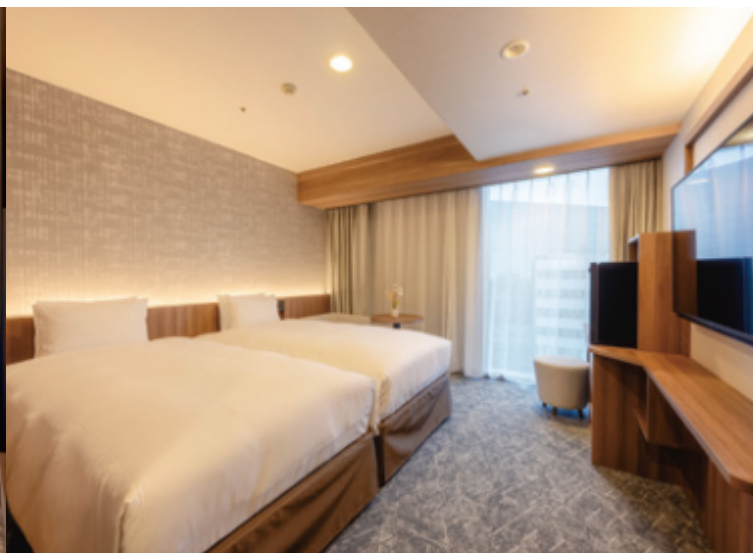
エグゼクティブフロアツインルーム (22㎡) ※一例

機能的で使い勝手の良いスタンダードフロアやスタイリッシュで上質なくつろぎを追究したエグゼクティブフロアなどさまざまなシーンでのご滞在を楽しく演出します。