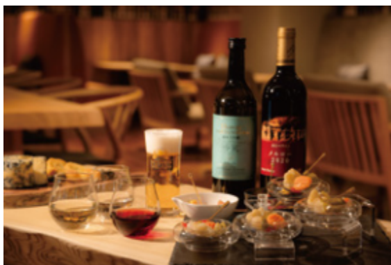
エグゼクティブラウンジ

また、客室キー連動エレベーターの設置による、万全のセキュリティで安心してご利用ください。