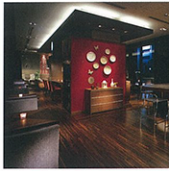
1F/ホテル直営レストラン ボンサラーテ・カフェ

「しっかりと朝食をとりたい!」 というニーズにお応えして、厳選した 食材をいつもおいしい状態で ご提供します。しっかりと朝食 で充実した一日の活力を。