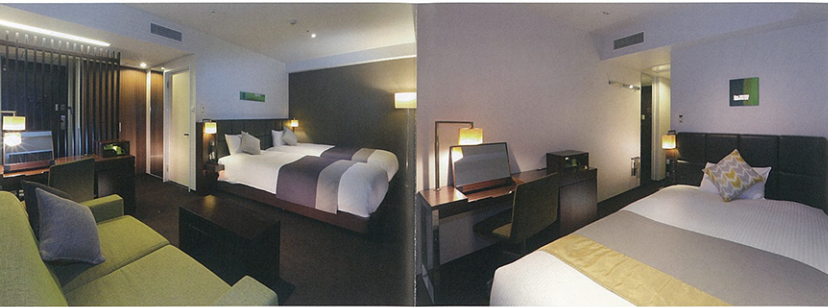
デラックススイートルーム